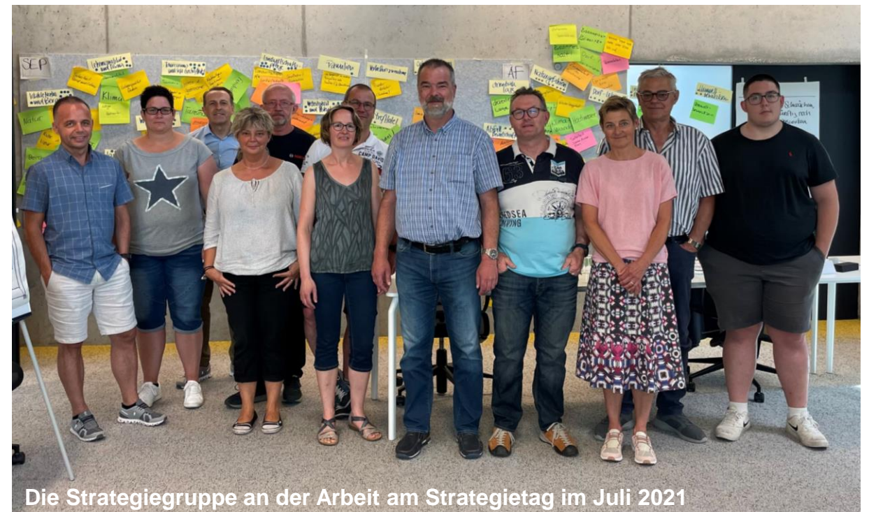
Die Strategiegruppe an der Arbeit am Strategietag im Juli 2021