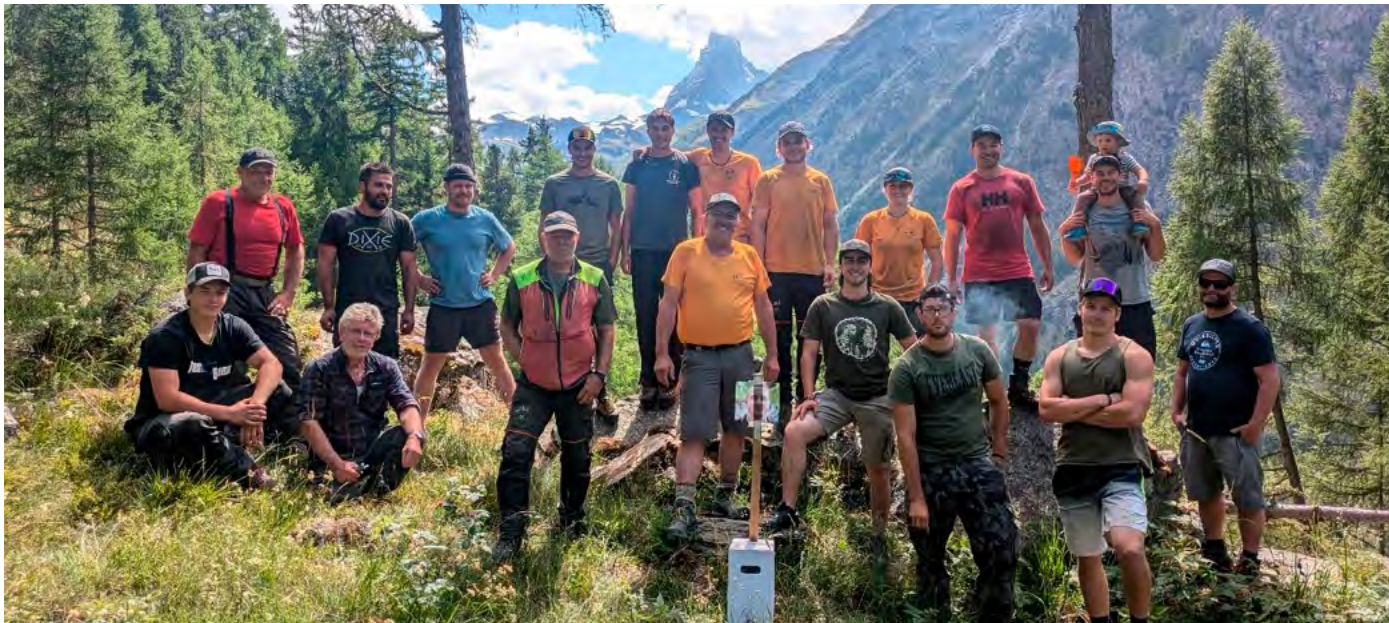
Ein Teil der an der Wiederherstellung nach dem Ereignis vom 17. April beteiligten Akteure.